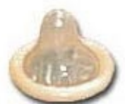
Condón de látex enrollado

Aprieta la punta del condón para que no quede aire adentro y sujetar la punta mientras se desenrolla en condón sobre la base del pene